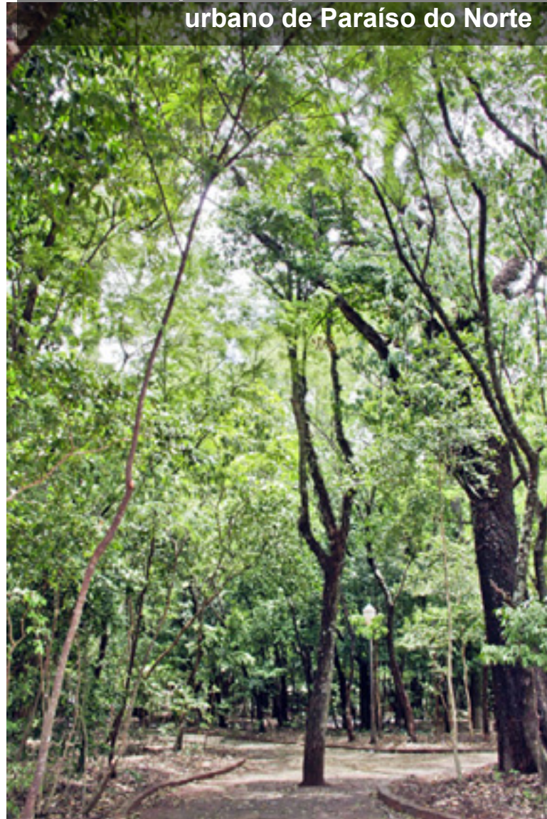
Bosque do paraíso, perímetro urbano de Paraíso do Norte