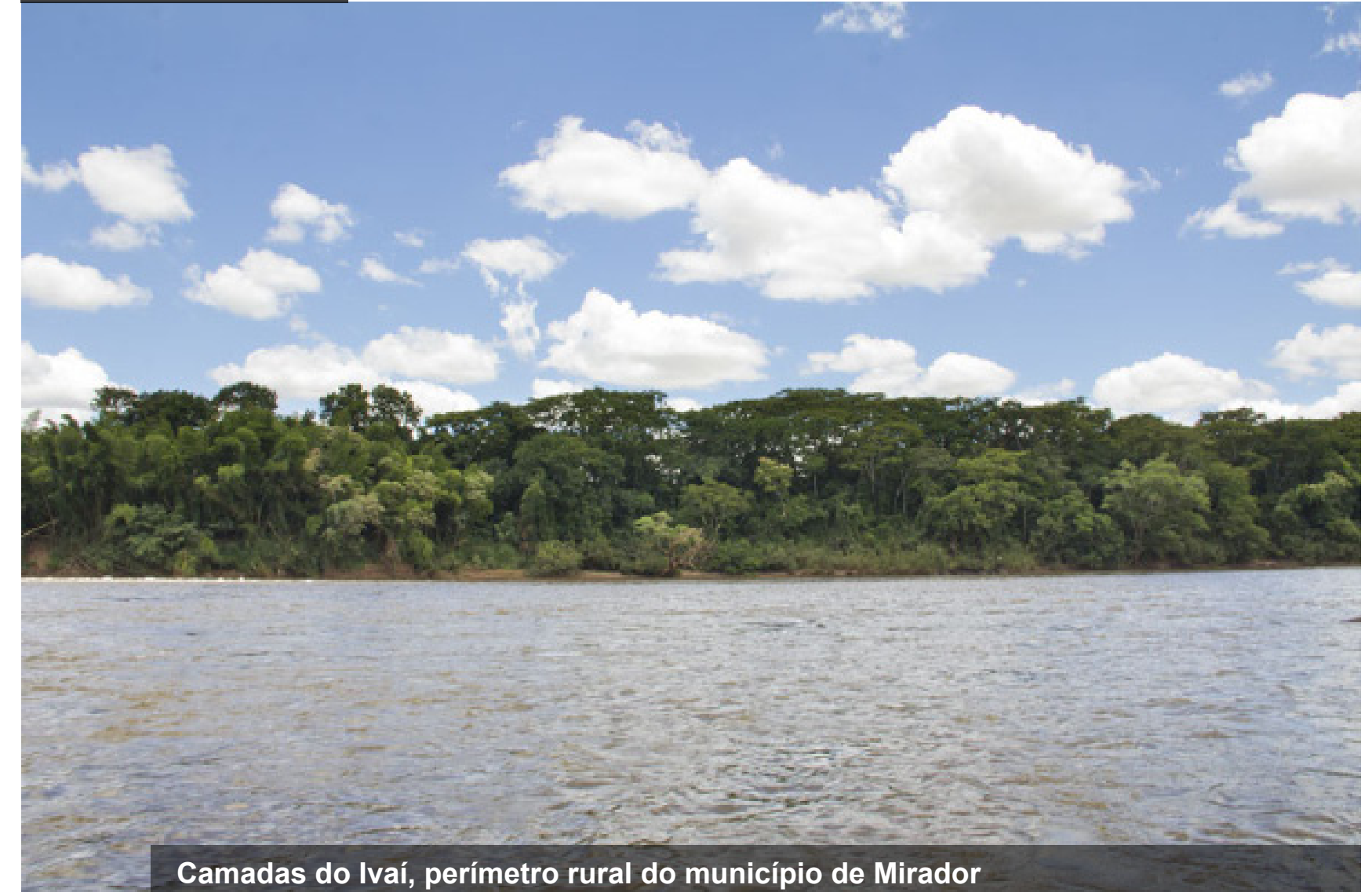
Camadas do Ivaí, perímetro rural do município de Mirador