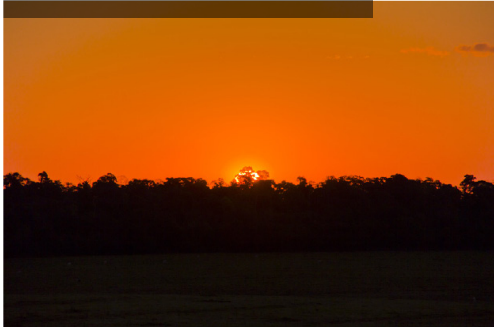
Alaranjou silhuetas, vista da estrada rural de Paranaí