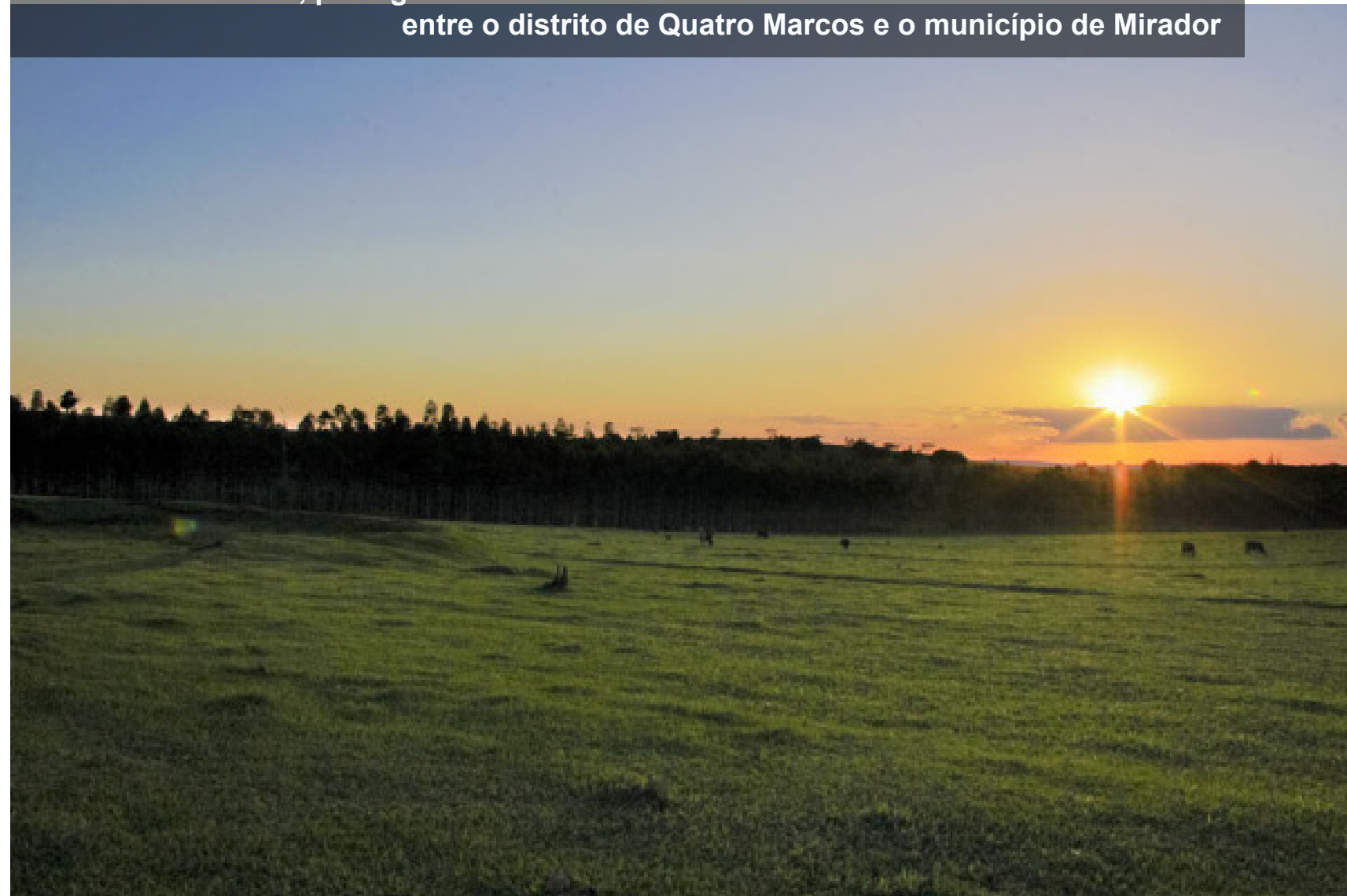
Nas cores do Brasil, paisagem rural à beira da estrada rural PR-180 entre o distrito de Quatro Marcos e o município de Mirador