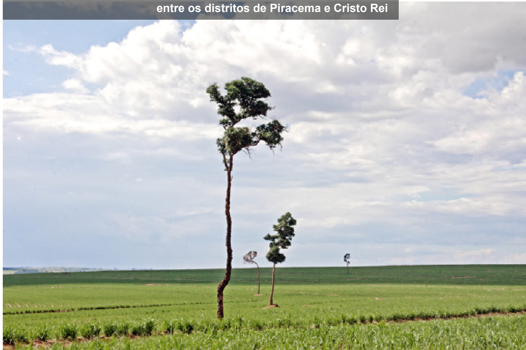
Velhas árvores, novas canas, uma vista da estrada rural entre os distritos de Piracema e Cristo Rei