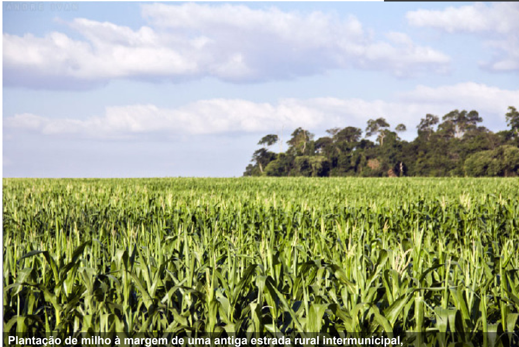
Plantação de milho à margem de uma antiga estrada rural intermunicipal, antigo trajeto entre Paranavaí e São João do Caiuá