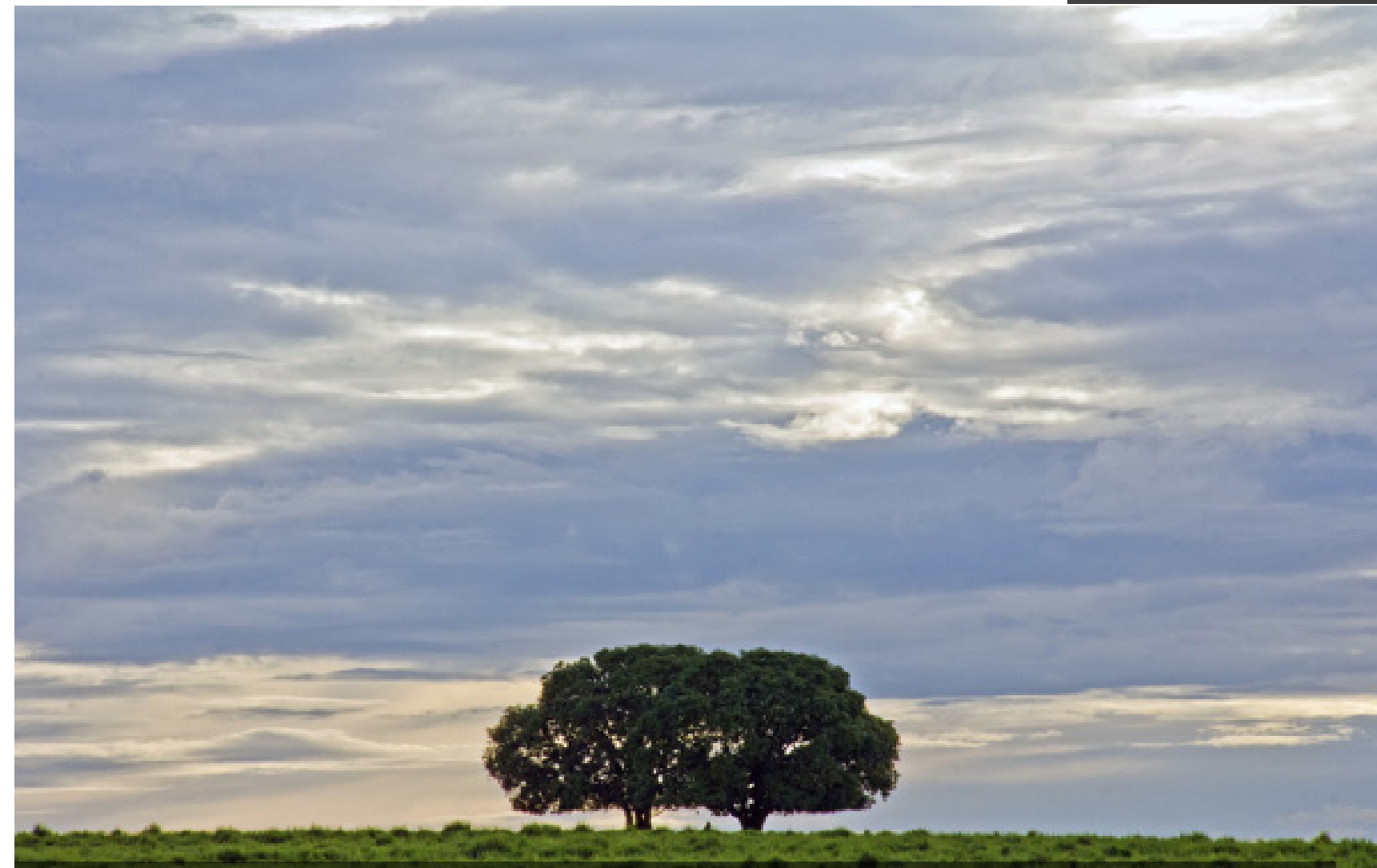
Solitárias irmãs em paisagem campestre na estrada rural de Paranaíba