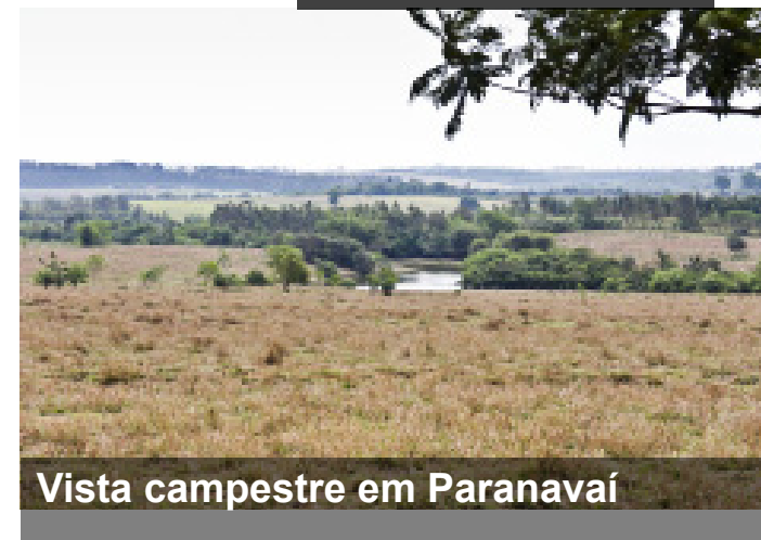
Vista campestre em Paranavaí