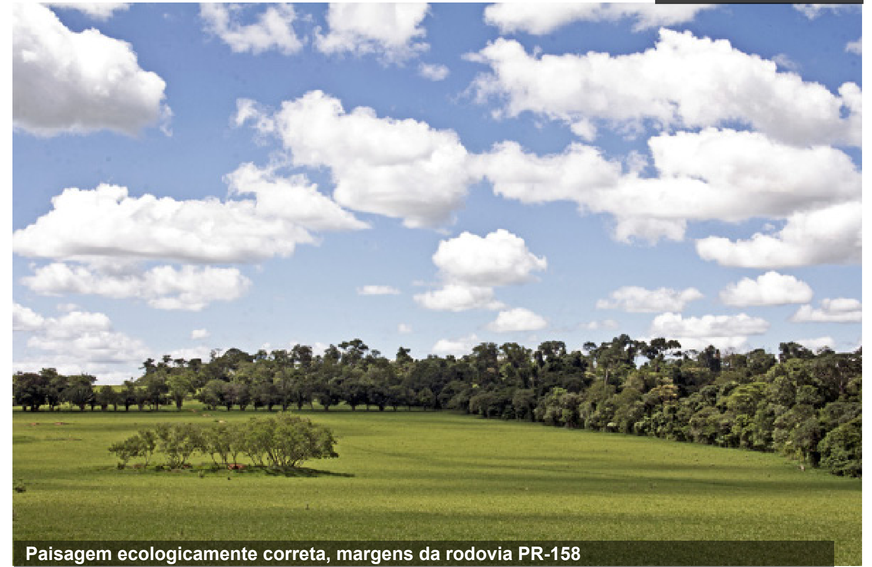
Paisagem ecologicamente correta, margens da rodovia PR-158 entre os municípios de Paranavaí e São João do Caiuá