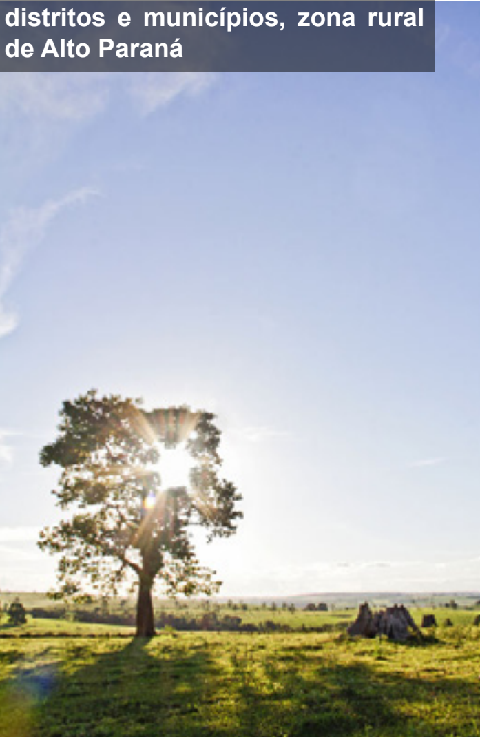
A iluminada, estrada rural entre distritos e municípios, zona rural de Alto Paraná