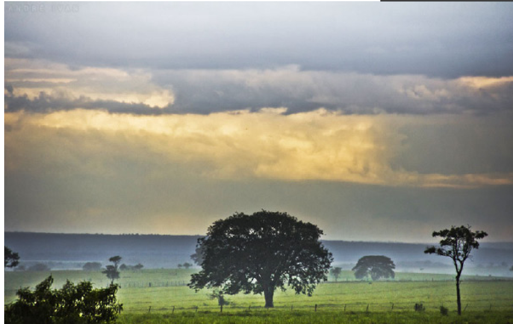
Entardecer chuvoso às margens da rodovia PR-557, próxima ao município de Santo Antonio do Caiuá