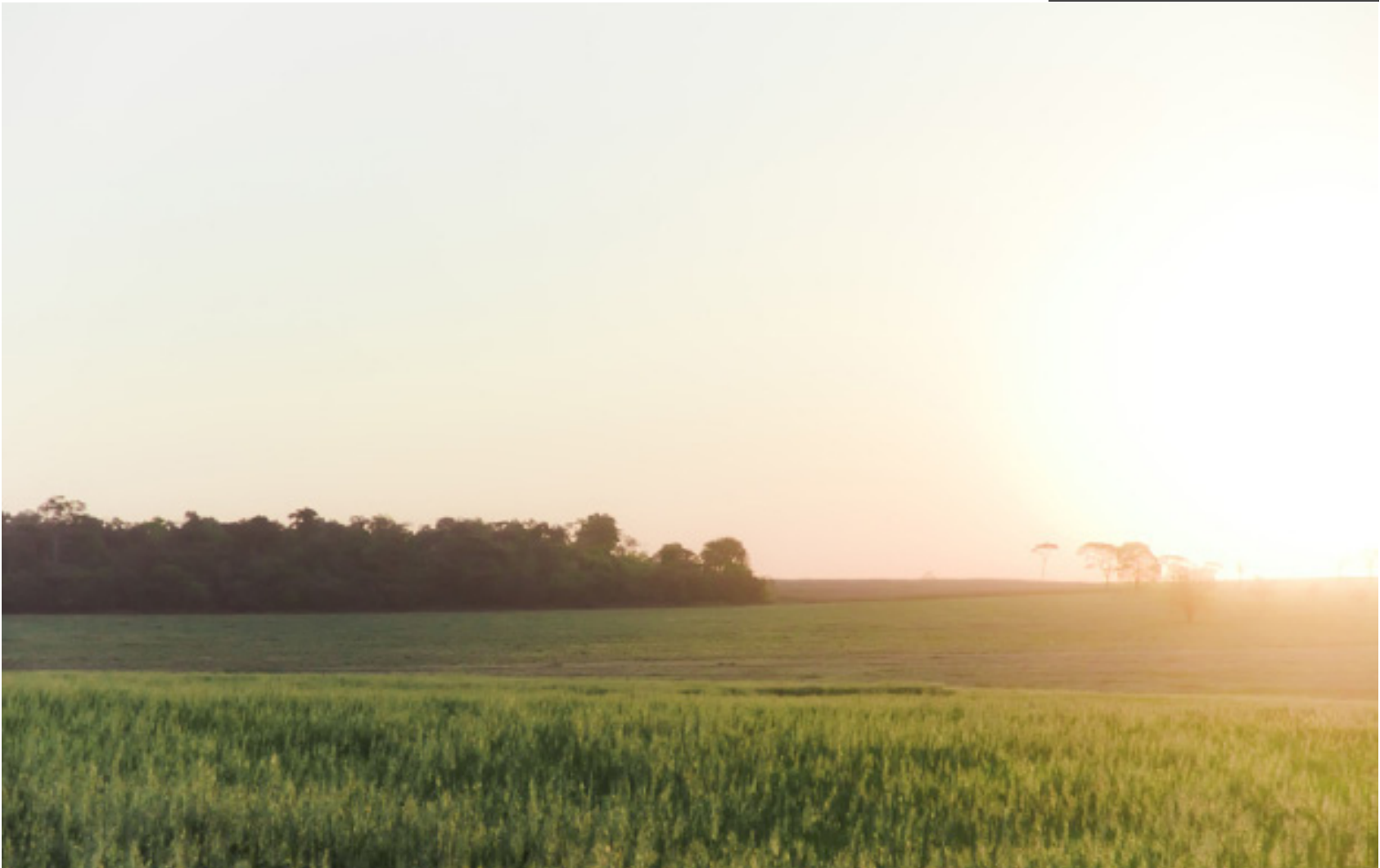
Forte brilho, iluminando às margens de uma estrada rural do município de Paranavaí