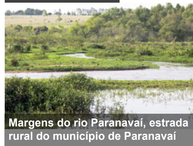
Margens do rio Paranavaí, estrada rural do município de Paranavaí