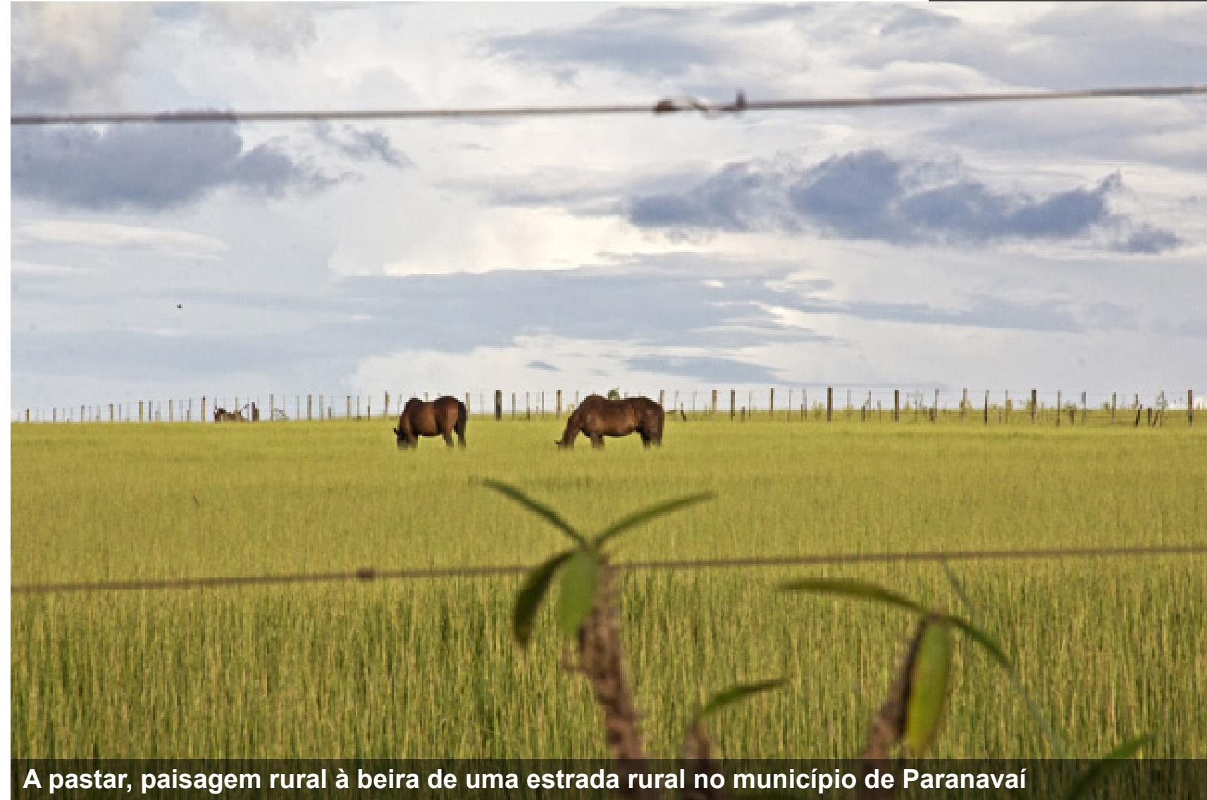
A pastar, paisagem rural à beira de uma estrada rural no município de Paranavaí

‘Jovem’ plantação de cana-de-açúcar, margens da rodovia PR-580, próxima ao perímetro urbano do município de Paranavaí