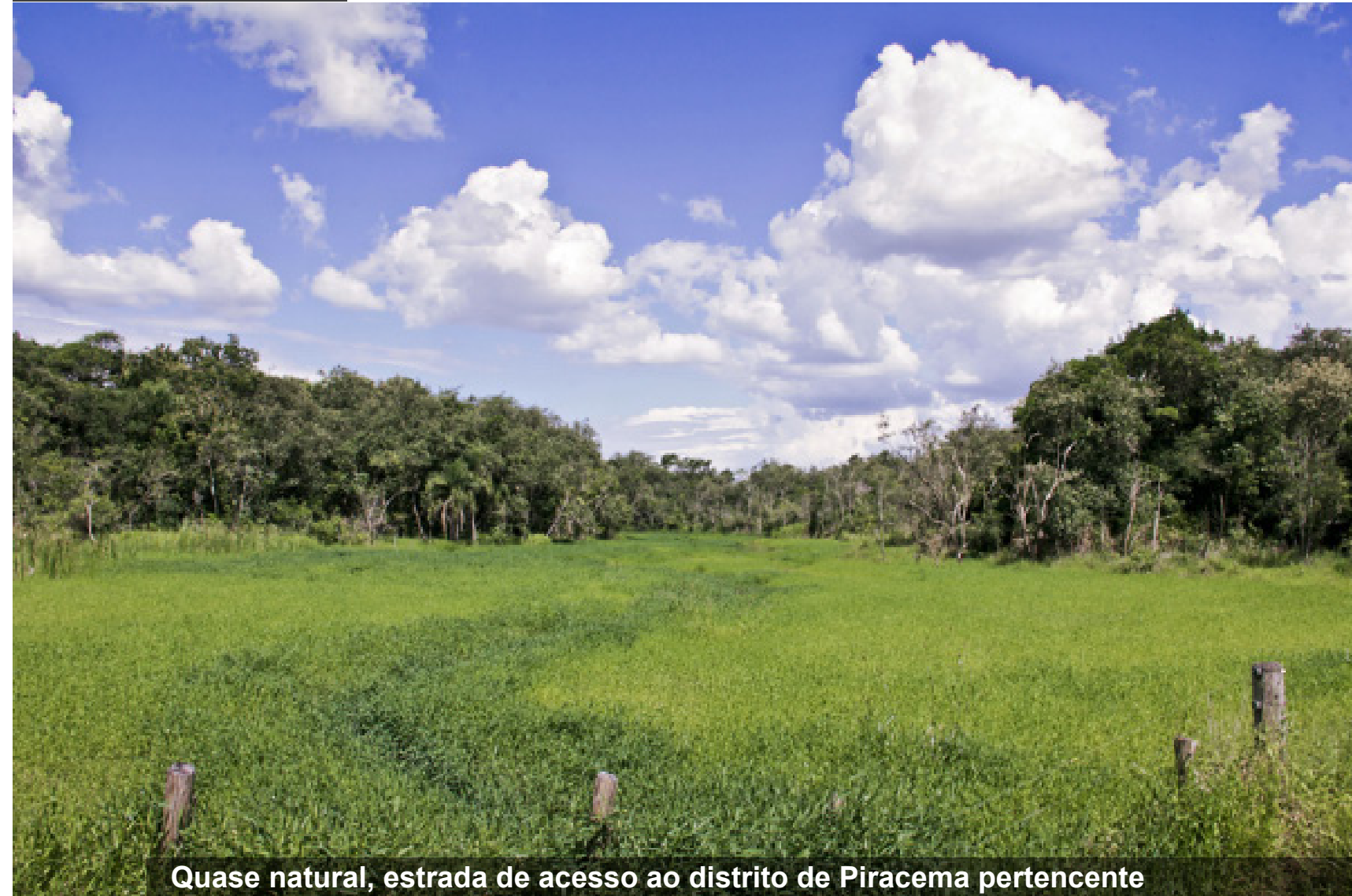
Quase natural, estrada de acesso ao distrito de Piracema pertencente ao município de Paranavaí

Vista de lembranças, região rural próxima à zona urbana de Paranavaí