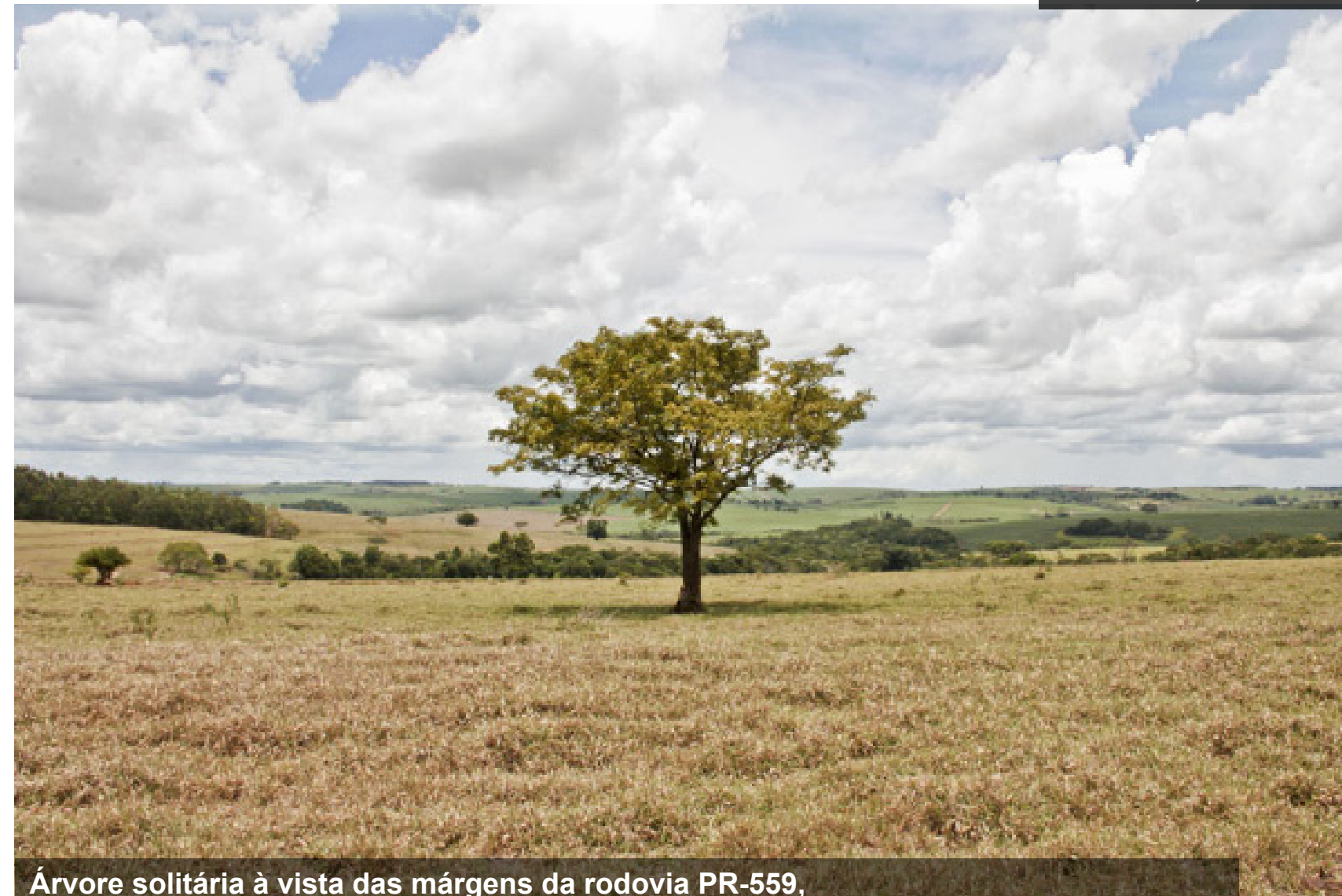
Árvore solitária à vista das margens da rodovia PR-559, entre Paraíso do Norte e São Carlos do Ivaí