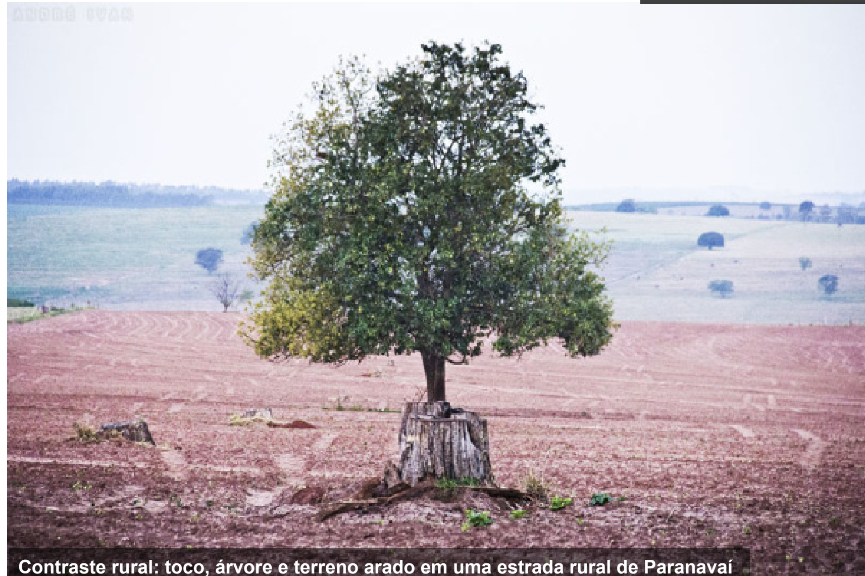
Contraste rural: toco, árvore e terreno arado em uma estrada rural de Paranavaí

A última, estrada rural entre distritos e municípios, zona rural de Alto Paraná