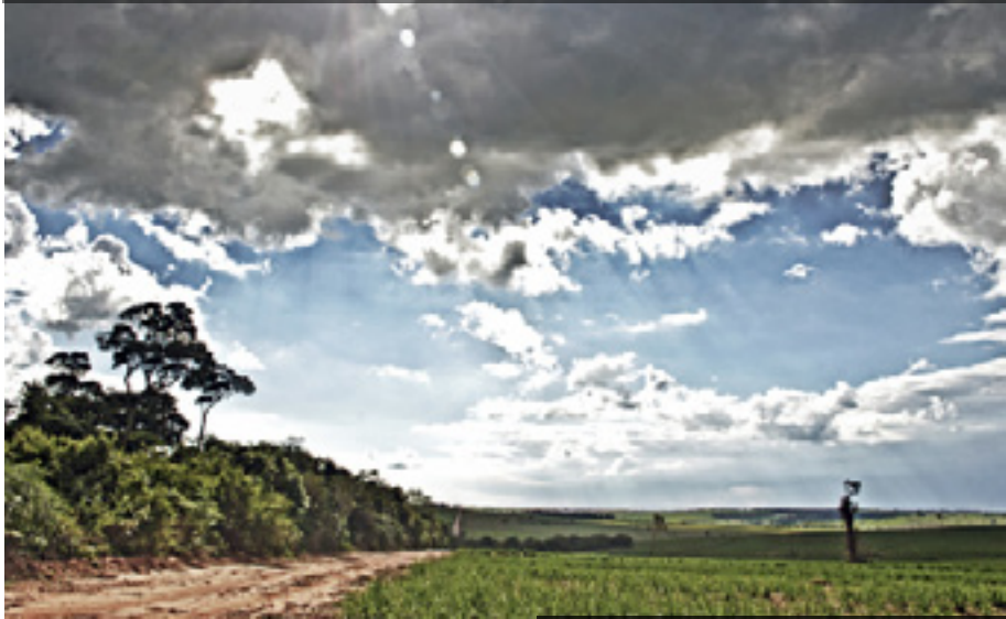
Paisagem em HDR, estrada rural entre os distritos de Piracema e Cristo Rei

Em terras planas, a possibilidade de assistir à natureza em ação é grande. O solo e o céu, traços e contornos, brilhos e cores se fundem e compõem a cena. Em alguns cliques o tempo para, e o momento é eternizado.