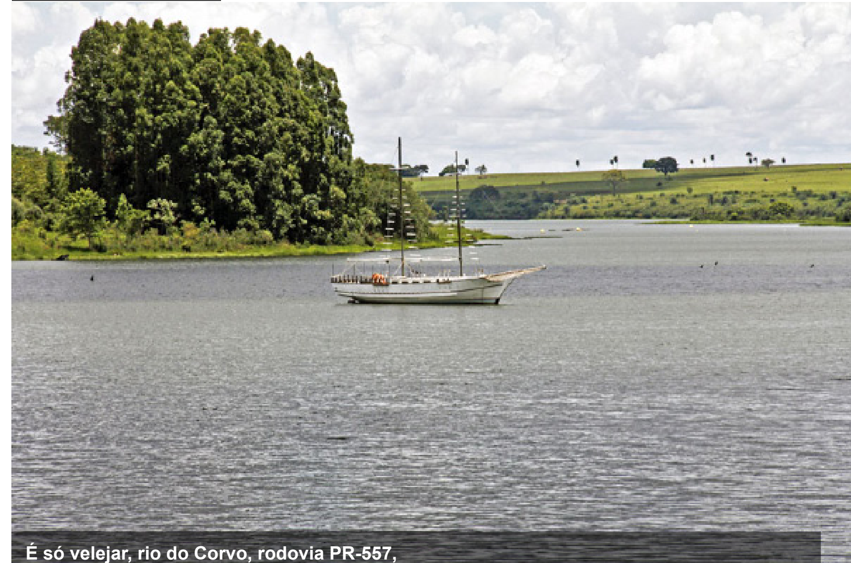
É só velejar, rio do Corvo, rodovia PR-557, perímetro rural do município de Diamante do Norte