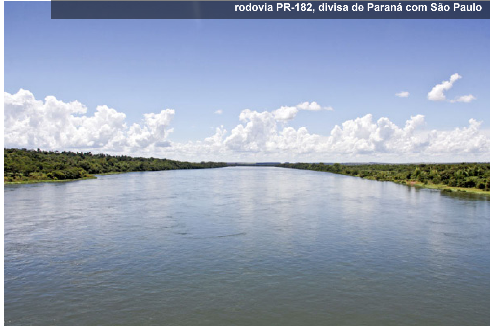
Sobre o Paranapanema, ponte próxima à Usina de Rosana, rodovia PR-182, divisa de Paraná com São Paulo