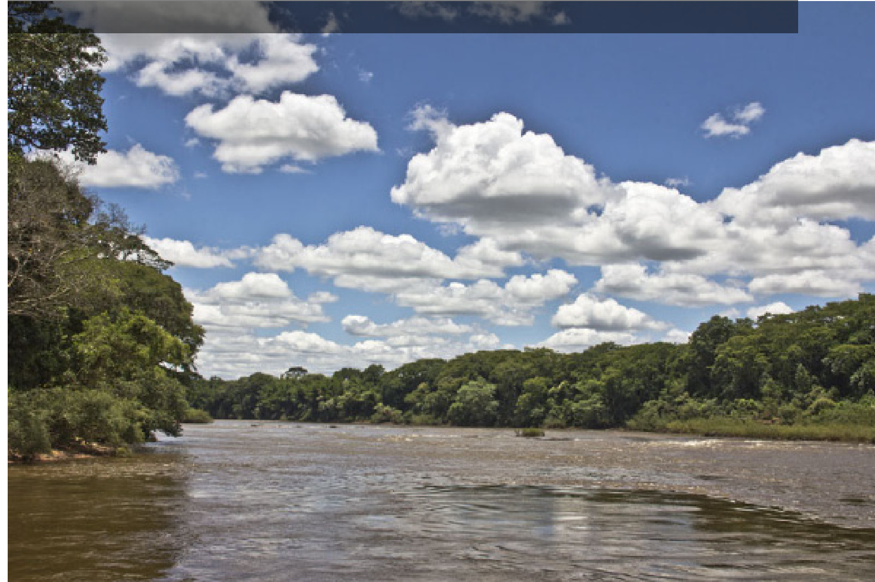
Curvas do rio Ivaí, zona rural do município de Mirador