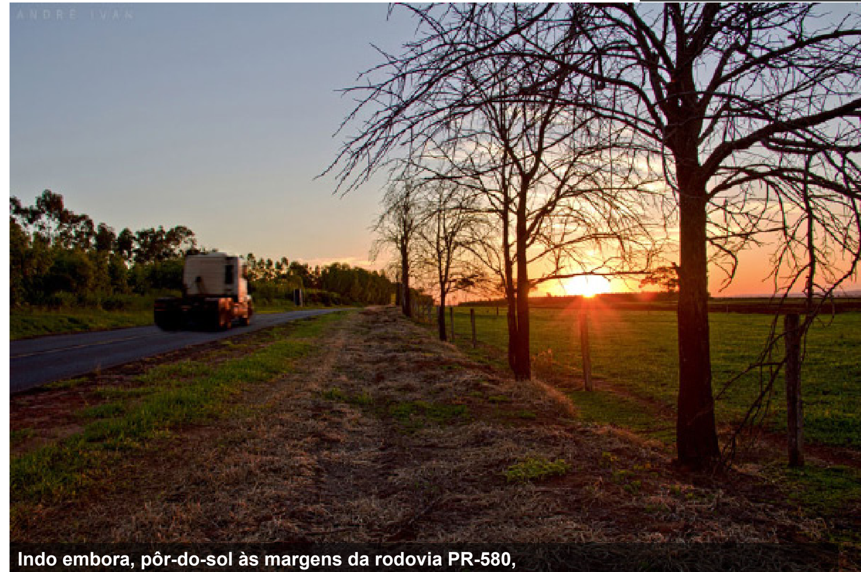
Indo embora, pôr-do-sol às margens da rodovia PR-580, sentido município de Tamboara próximo a Paranavaí