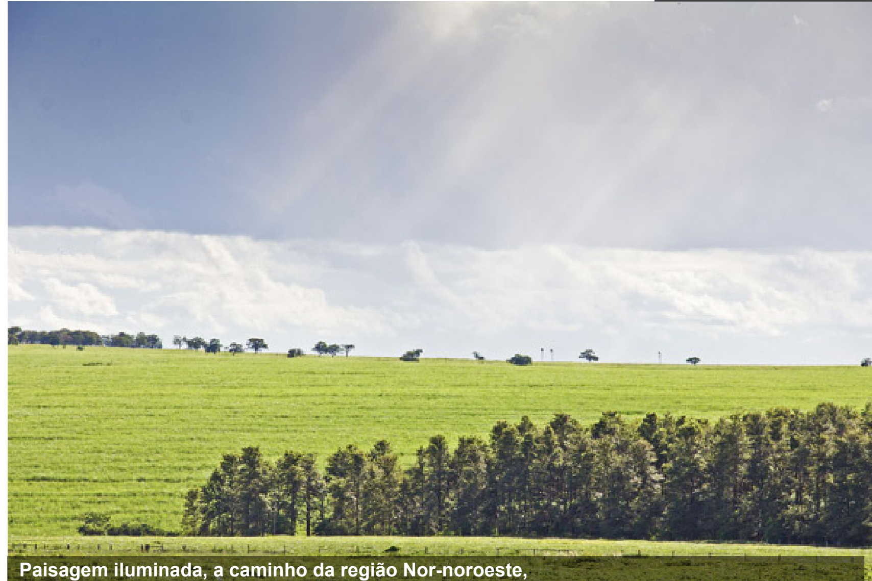
Paisagem iluminada, a caminho da região Nor-noroeste, margens da rodovia BR-376, próxima ao município de Presidente Castelo Branco