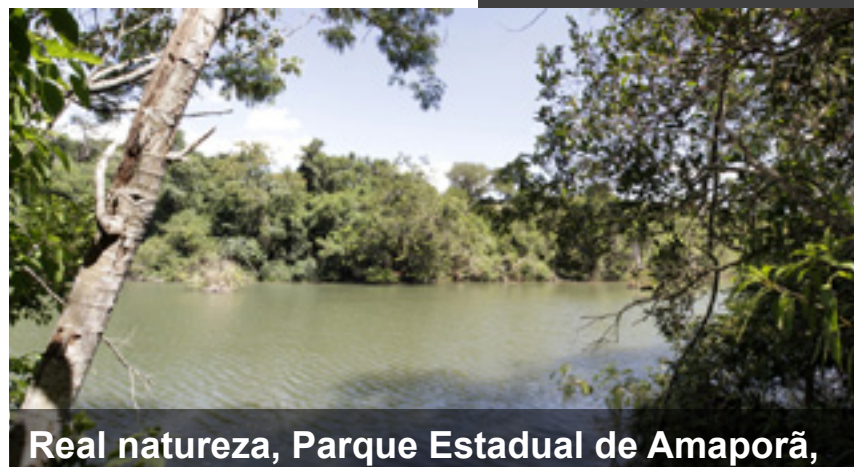
Real natureza, Parque Estadual de Amaporã, próximo à PR-218, município de Amaporã

Refrescante, margens de uma estrada rural próxima ao distrito de Sana Maria, área rural do município de Alto Paraná